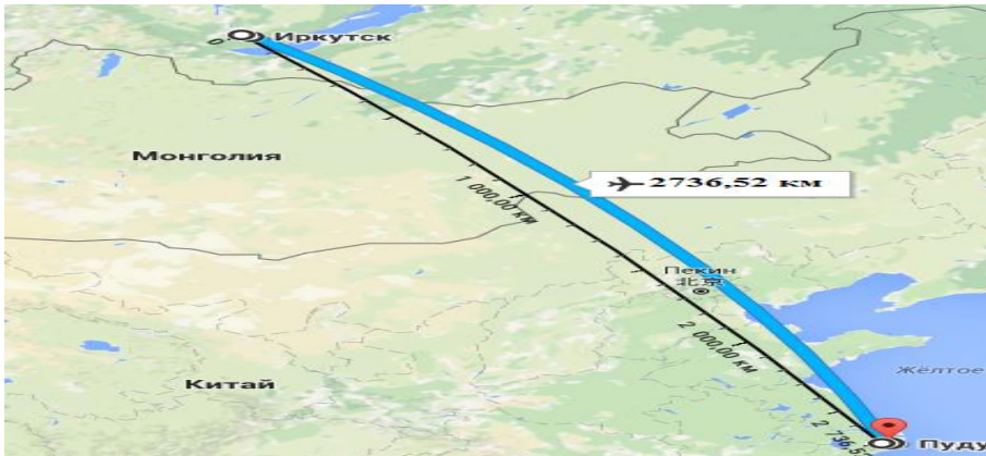
Рисунок 2 – Ортодромия ИКТ– PVG