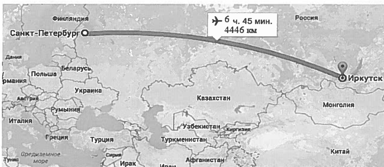
Рисунок 1 – Ортодромия LED – ИКТ