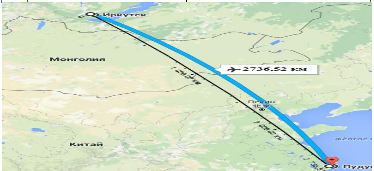
Рисунок 2 – Ортодромия ИКТ– PVG