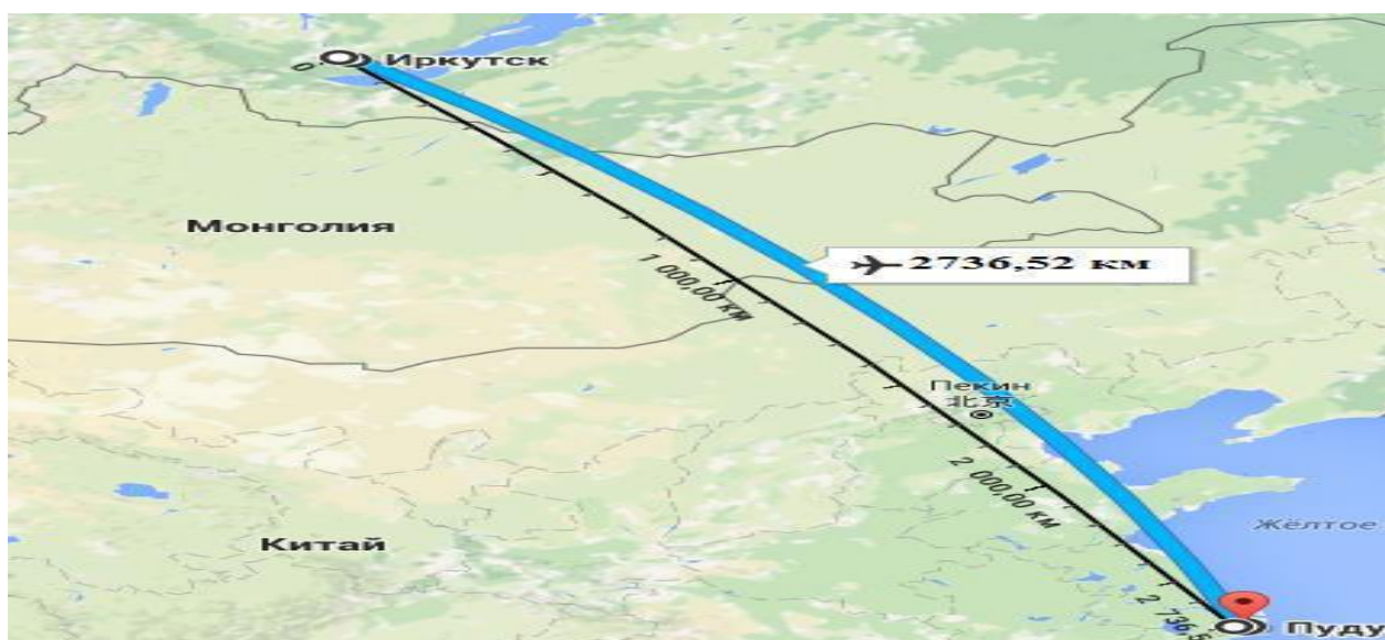
Рисунок 2 – Ортодромия ИКТ– PVG