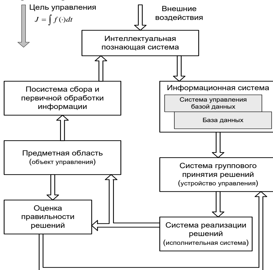
Рис. 1. Функциональная схема автоматизированных и автоматических систем принятия решений.

Задача 1. Назначение блоков автоматических и автоматизированных систем принятия решений.