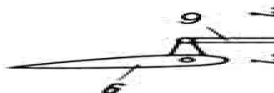
Рисунок 2 - Схема обратимого гидроусилителя: 2 – рычаг управления рулем; 2 – золотник; 3 – шток; 4 – поршень; 5 – гидроцилиндр; 6 – руль; 7 – качалка; 8, 9 - тяги

Задача 2. Как изменится усилие на рычаге управления от действия шарнирного момента, если плечо l_2 качалки увеличить, а плечо l_1 уменьшить (см. рис. 2 )?